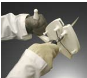
Trzymana w ręku