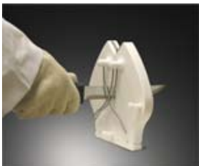
Montowana do stołu

COZZINI PRIMEEdge CUTTING EDGES AND SHARPENING SOLUTIONS