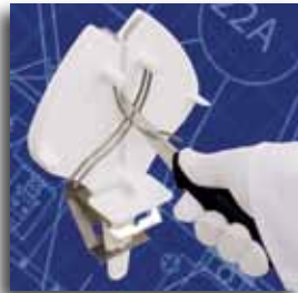
Bracket installed for use at work table height