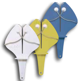
Available in white, yellow or blue