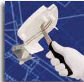
Bracket installed for use at elevated height