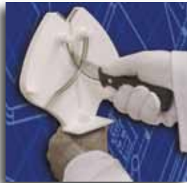
Use hand-held, right or left handed

Obsługa nie wymaga szkolenia. Ergo Steel III jest urządzeniem wygodnym i bezpiecznym do trzymania w rękę przez prawo- lub leworęcznego operatora. Odpowiednia rączka, którą można łatwo umieścić w specjalnym uchwycie mocującym ze stali nierdzewnej, pozwala na błyskawiczne zamontowanie ostrzałki do stołu.